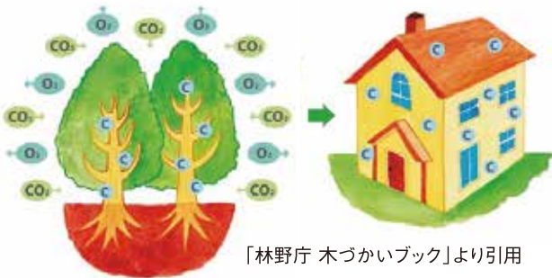
「林野庁 木づかいブック」より引用

木は二酸化炭素(CO2)を吸収し、炭素(C)として体内に蓄える能力があります。その能力は木製品や住宅として利用される期間も継続することから、木は「炭素の缶詰」と言われます。伐採した跡地に木を植えて育てることで、新しい炭素の貯蔵庫となります。二酸化炭素を吸収する貯蔵庫が増えるので、地球温暖化防止につながります。